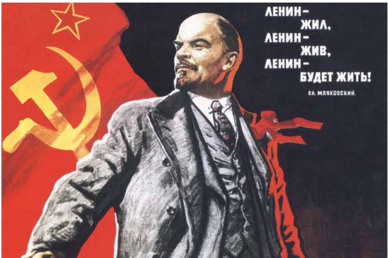
Lenin lebte, Lenin ist lebendig, Lenin wird leben.

Nach dem Tode Alexanders II. 1881 – er fiel einem Attentat der Untergrundorganisation «Narodnaja Wolja» zum Opfer – setzte eine reaktionäre Periode ein, die bis zur Revolution von 1905 dauerte. Im Unterschied zu all seinen Vorgängern seit Katharina der Grossen hatte der neue Zar Alexander III. keine Liberalisierungs- und Reformversuche vorgenommen, sondern gleich zu Beginn seiner Regentschaft zwischen 1881 und 1894 auf einen reaktionären Kurs gesetzt. 1882 erliess er die «Maigesetze», in denen die freie Berufsausübung und Freizügigkeit der jüdischen Minderheit stark eingeschränkt wurden. Bei Alexander III. reifte die Ansicht, Russland wäre von anarchistischen